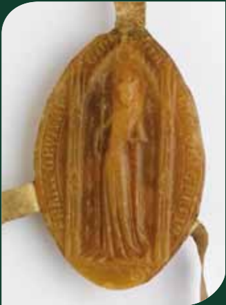
Sceau de Marie de Brabant, J 429 n° 3.