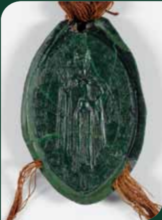
Sceau d'Adèle de Champagne, S 2168 a n° 61.