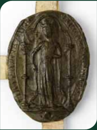
Sceau de Marguerite de Provence, L 1050 n° 12 a .