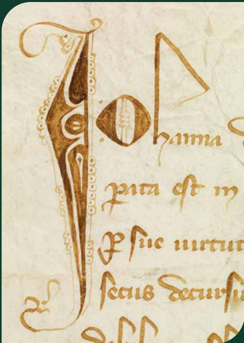
Charte de Jeanne de Champagne, AE/II/308.