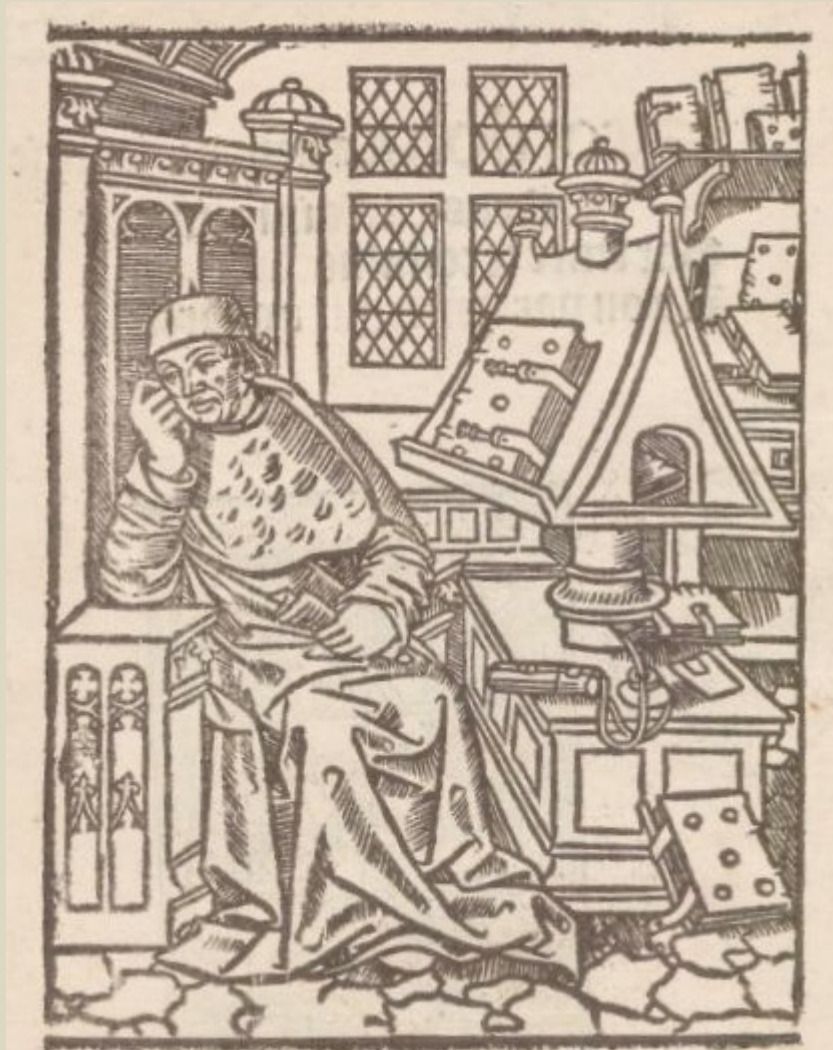
Bernard de Gordon, La Fleur de Chirurgie , Paris, J. Petit, 1504, frontispice.

Maison des Sciences de l'Homme Paris Nord 4, rue de la Croix Faron 93210 Saint-Denis La Plaine